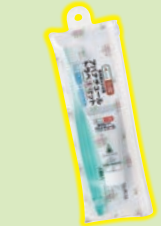
品・ナの色は 品・ナの色は 品・ナの色は

▽解き方 普通のクロスワードの要領で全部解いて下さい。 次にA↓Eの二重ワクの文字を順に並べると、一つの言葉ができます。それが答えです。 ▽応募方法 官製ハガキに答えを記入し、あなたの住所・氏名・年齢・職業を書いて応募して下さい。1人につきハガキ1枚を有効とします。 ▽締切 4月20日 (当日消印有効) ▽発表 本誌5月号紙上 ▽あて先 〒889-4311 えびの市大明司 総務課 JAえびの市 ▽正解者の中から抽選で5名にアパナチュールトラベルセットをプレゼント