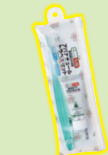
品・パナのや 品のア出し色 マークアラ外 ブマキ歯磨き エコー用歯磨 薬用歯磨き エコー用歯磨 薬用歯磨き